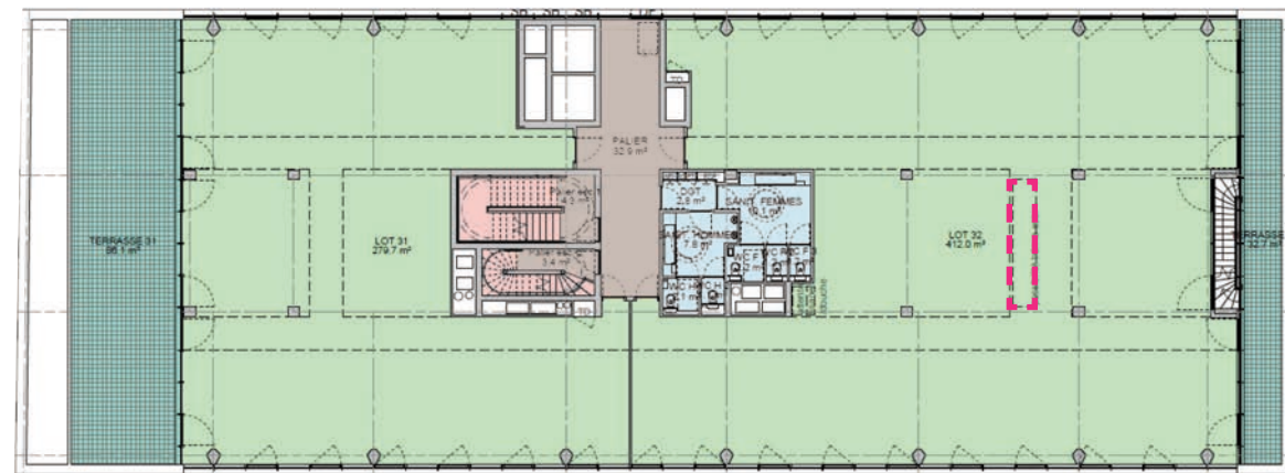
R+3 787 m 2