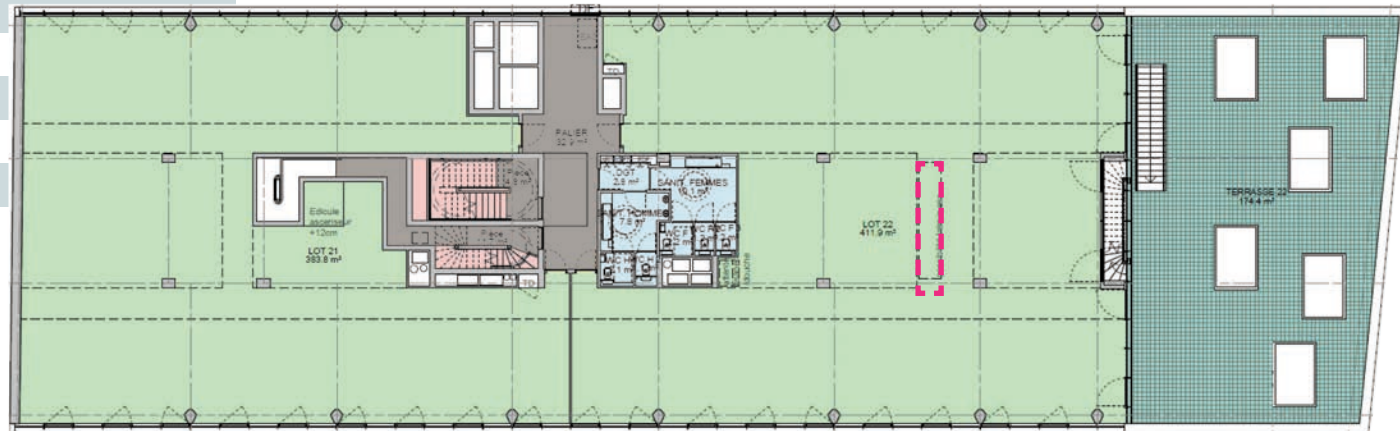
R+2 910 m 2